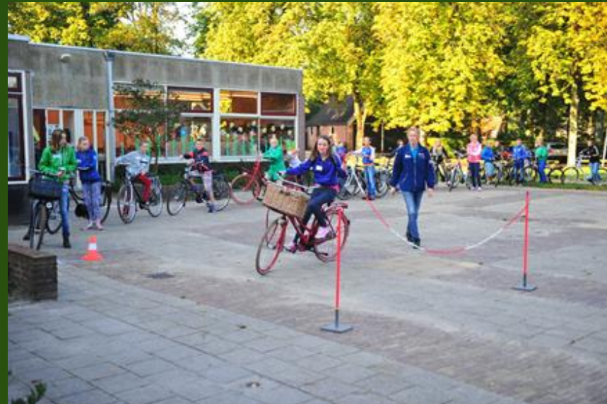
Voor groep 7 en 8: Trapvaardig