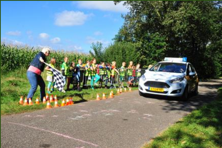
Voor groep 5 en 6: Hallo Auto