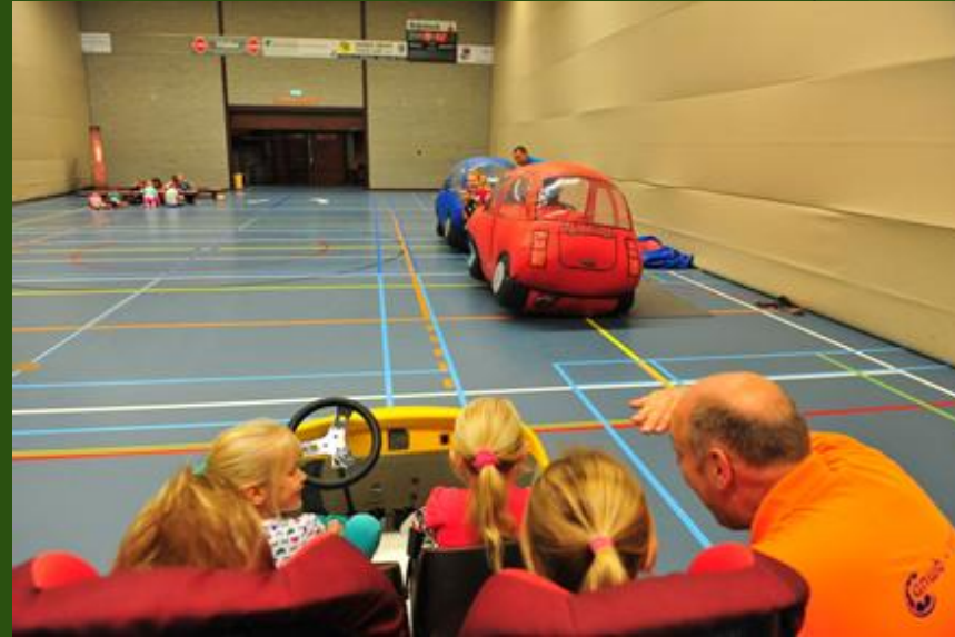
Voor groep 3 en 4: Blik en Klik