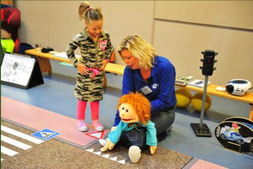
Voor groep 1 en 2 : Toet Toet